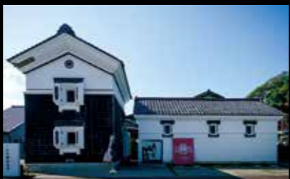
峰村酿造 有着创业110年以上历史的味噌仓库。可以参观工厂，还有可以买到味噌和酱菜等的店铺、咖啡馆。 #niigatamiso #nuttari #minemurajozo