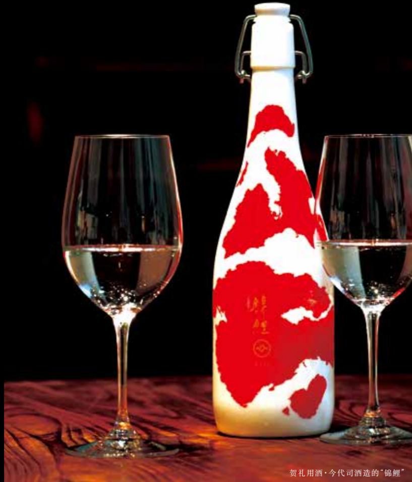
贺礼用酒·今代司酒造的“锦鲤”

汇聚了5家葡萄酒厂的新潟葡萄酒海岸线，酒厂酿制着各具特色的葡萄酒。 #wine #niigatawinecoast #niigatalove