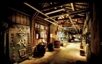
今代司酒造 约250年前创业的老字号酒窖。可以参观酒窖和试饮，还可以购买产品。 #niigatasake #nuttari #imayotsukasa