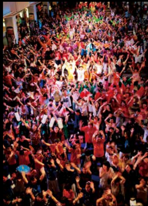
新潟总舞节 这是新潟市民参与的舞蹈盛典。舞者们的主干道摩肩接踵尽情舞动的情形堪称盛景。当天参加也完全OK。 #niigatasohodori #niigatalove