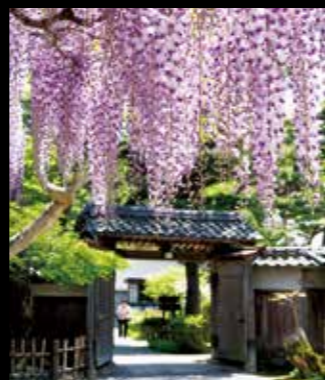
北方文化博物馆 原为昌盛的越后富农伊藤家的宅邸，如今作为博物馆公开。向现今的人们展示当年富裕的生活状态。 #northernculturemuseum #hoppoubunka #niigatalove