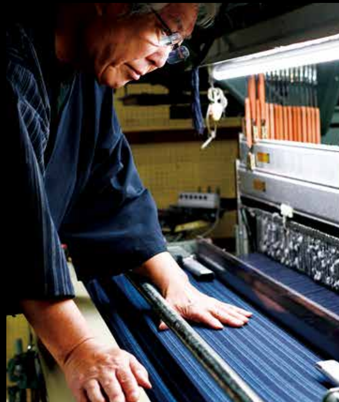
가메다지마(가메다 직물) 농작업용 옷의 원단으로서 탄생한 직물. 전통 색상 줄무늬가 있으며, 견고하면서도 부드러운 감촉이 특징. #kamedajima #niigatafabric #niigatalove