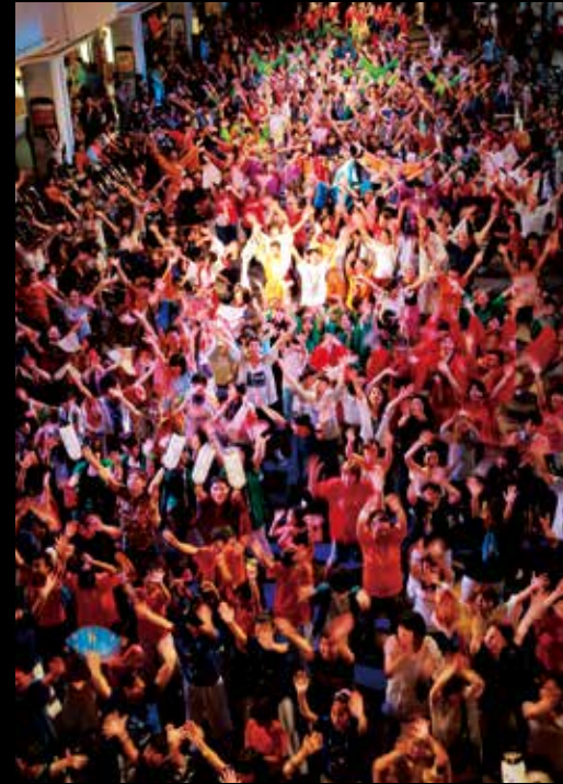
니가타 소오도리(춤의 제전) 시민이 참가하는 춤의 제전. 무용수들이 중심가를 뱅뱅이 돌지어 춤추는 모습은 압권입니다. 즉흥 참여도 OK. #niigatasohodori #niigatalove