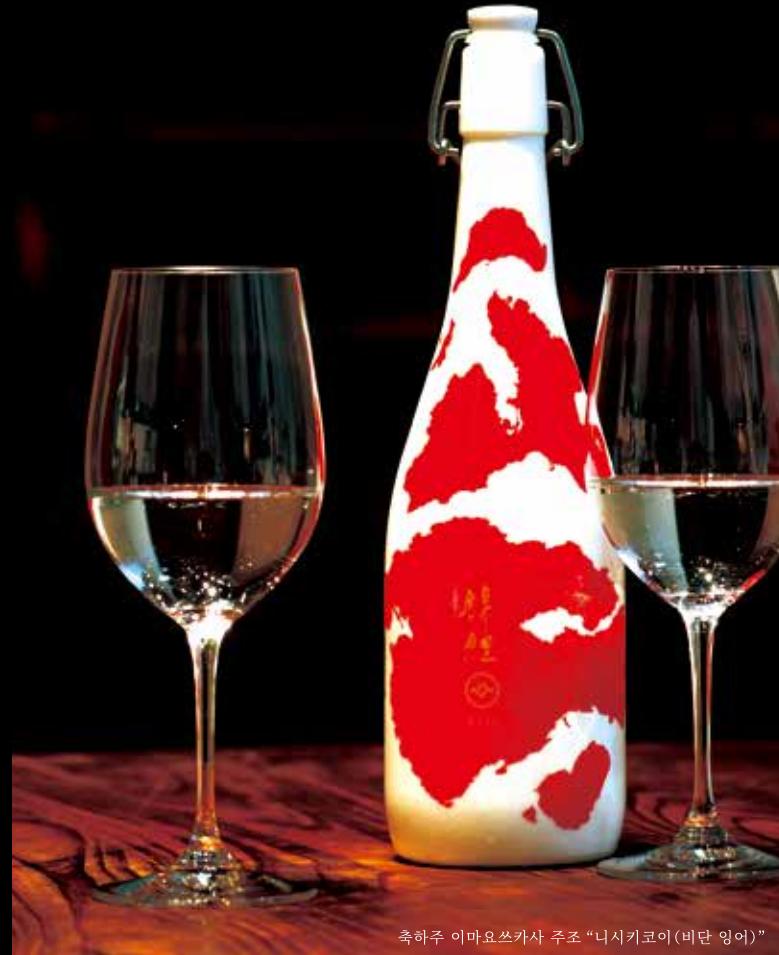
축하주 이마요쓰카사 주조 "니시키키코이(비단 잉어)"

와이너리 5곳이 모여있는 니가타 와인 코스트(wine coast)에서는 각 와이너리 고유의 와인을 양조합니다. #wine #niigatawinecoast #niigatalove