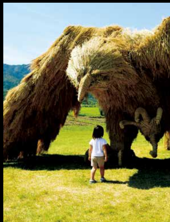
지푸라기 아트 쌀의 고장 니가타에서는 일찍이 벼짚을 가공하여 생활용구를 만드는 삶의 지혜가 있었습니다. 지금은 거대 지푸라기 아트가 니가타의 가을을 수놓습니다. #waraart #uwasekigata #niigatalove