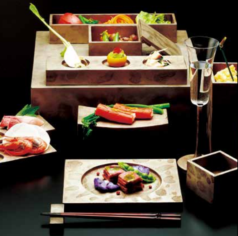
니가타 칠기 가와리누리(옷칠의 일종)의 보고로 불리는 니가타 칠기. 석기로서의 기능에 중점을 두고 만든 혁신적인 작품이 매력적입니다. #niigatashikki #japaneselacqueware #niigatalove

— Part 2 — [계승되는 기술과 전통 체험] 교역로 번영한 항구도시 니가타는 각 지역의 다양한 기술들이 전도되어 니가타의 독특한 문화로서 꽃피었습니다. 이 전통 기술은 지금도 진화를 거듭하고 있습니다.