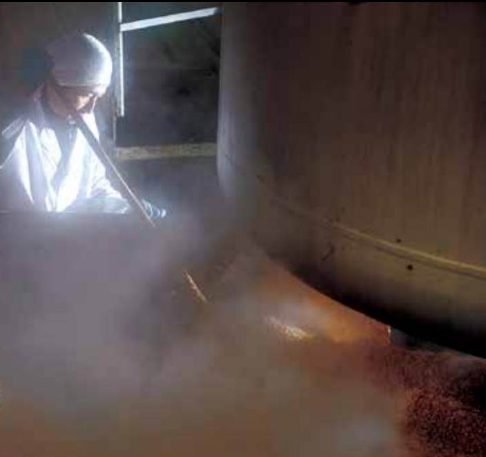
된장 양조장 배를 통해 들어온 소금과 대두가 니가타 쌀과 만나, 니가타의 발효문화로서 정작, 발전해 왔습니다. #niigatamiso #niigatalove