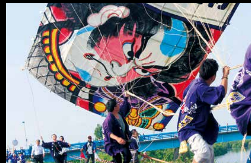
시로네 큰 연 대항전 정성 들여 만든 연을 띄워 공중에서 서로 얽힌 후 맞닿기는 다이내믹한 축제. 하늘 위로 멋진 그림이 그려진 큰 연이 춤추듯 나는 모습은 눈을 뗄 수 없게 만듭니다. #shirone #shironetako #niigatalove