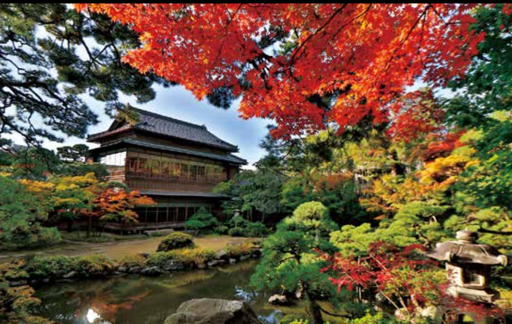
구 사이토 가문 별저 200년 전에 세워진 부농 사이토 가문의 별저. 니가타 상인의 번영을 집작게 하는 회유식 정원과 근대 일본풍 건축이 볼거리입니다. #theniigatasaitovilla #japanesegarden #niigatalove