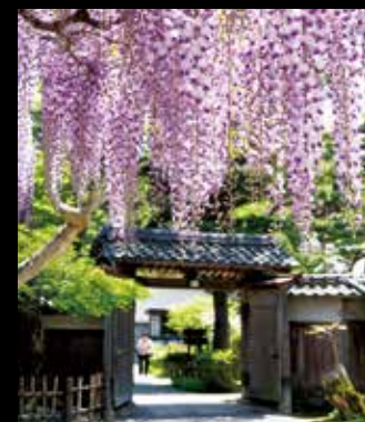
북방문화박물관 에치고의 부농으로서 번영했던 이토 가문의 저택을 박물관으로 공개중. 호화로웠던 생활을 짐작할 수 있습니다. #northernculturemuseum #hoppoubunka #niigatalove