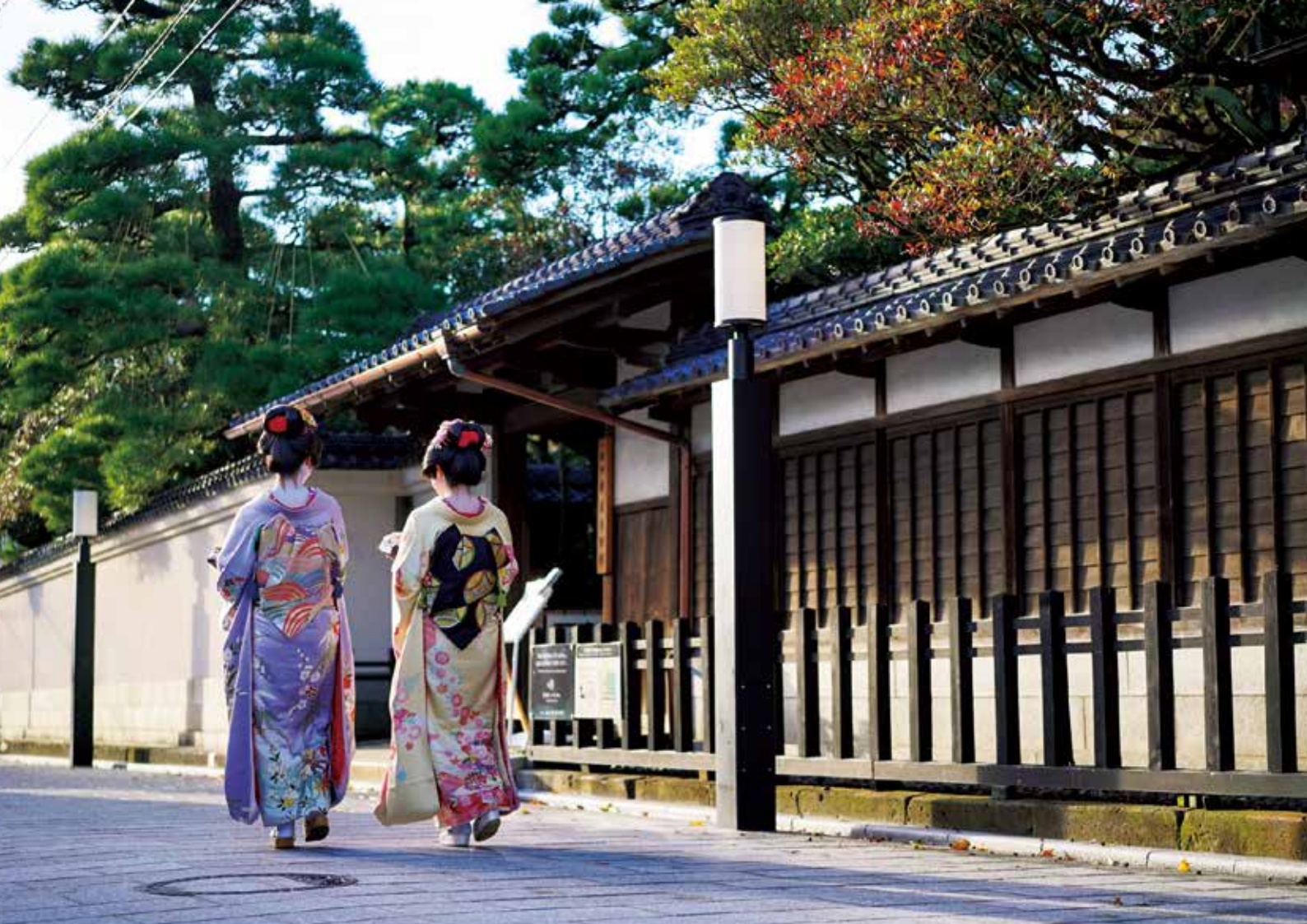
니가타 후루마치 게이기(일본 전통기생) 200년의 전통을 지닌 니가타 후루마치 화류계. 세련되고 화려한 공연으로 항구도시 니가타의 절대 문화를 느껴볼 수 있습니다. #furumachigeigi #furumachi #niigatalove